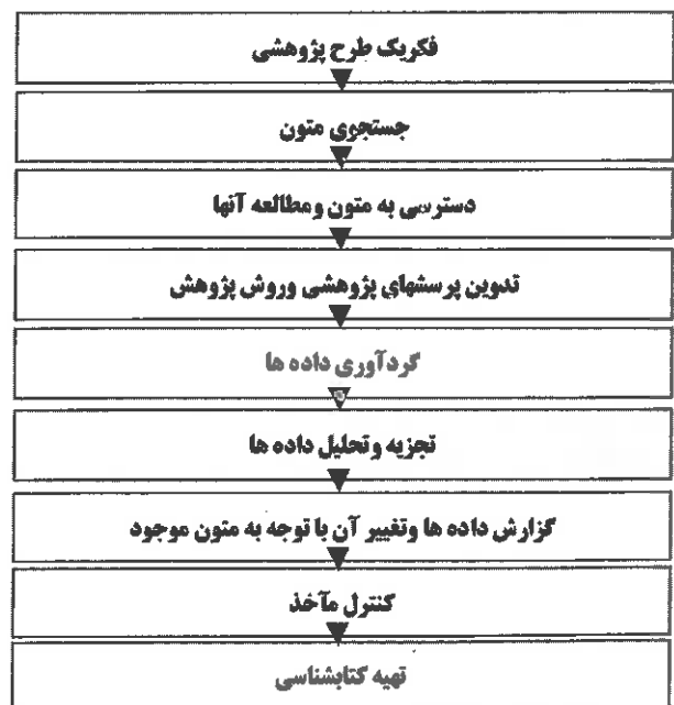
شکل (۱) - مدل ساده‌ای از فرایند پژوهش، نمونه‌ای از یک پژوهش میدانی

هر پژوهش اعم از طرح پژوهشی یا پایان‌نامه، فرایند مشخصی را باید طی کند تا به نتیجه مطلوب برسد. کتابها و مقاله‌های بسیاری درباره مراحل این فرایند یا "مدل پژوهش" نوشته شده است تا به پژوهشگر در برنامه‌ریزی و پیشرفت کار کمک کند. برخی منابع نیز فرایند پژوهش را به صورت نمودار گردش کار ترسیم کرده‌اند که می‌تواند برای پژوهشگران، به ویژه دانشجویان سودمند باشد. پیش از پرداختن به بحث کاربرد منابع مرجع در بهبود فرایند پژوهش، لازم است یکی از الگوهای این فرایند را به صورت مدل زیر ارائه کرد. الگوی پیشنهادی بری (نقل شده رضایی شریف آبادی، ۱۳۷۸، صفحه ۴۷) ۲ به صورت روشن، فرایند پژوهش را به تصویر در آورده است.